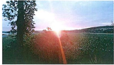
Sonnenaufgang in Krickelhof 2017

Auch heuer übernimmt die Freiwillige Feuerwehr Weierhammer wieder den Begleitschutz, den Shuttle-Verkehr und die Organisation der Pausen. Dafür gilt ihr schon im Voraus unser aller Dank!