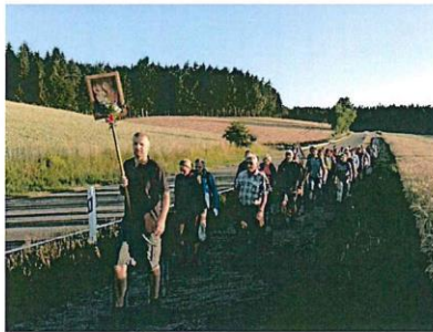
Fußwallfahrt 2019 (Zulauf auf Pursruck)

In Amberg wird um 09:00 Uhr der Pilgergottesdienst für die Fußwallfahrer aus Weierhammer und Kohlberg gefeiert.