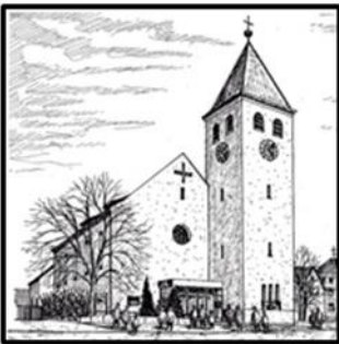
Herz Jesu - Kohlberg