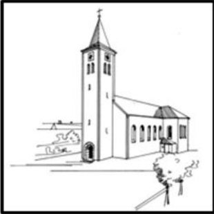
St. Martin – Kaltenbrunn