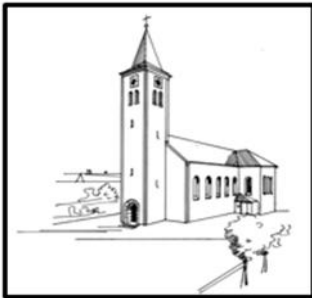
St. Martin – Kaltenbrunn