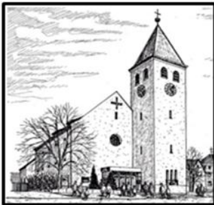
Herz Jesu - Kohlberg